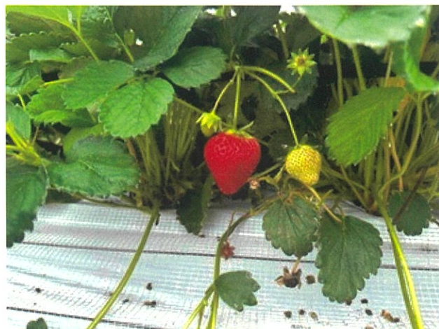
↑↑↑ (去年、いちご狩りに行った時の写真です🍡♪)

いちごノミーチは通年販売しておりますが、やはり春の時期に一番多くのご注文をいただきます🍡✨